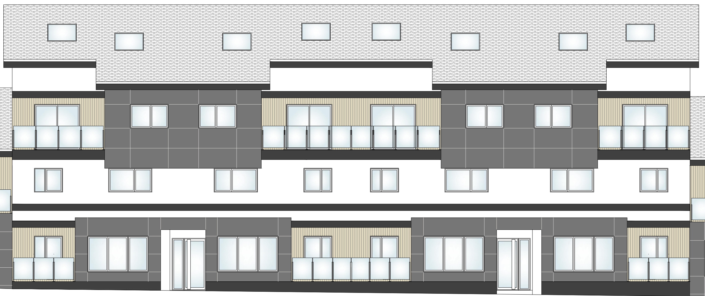
ALZADO PRINCIPAL BLOQUE DE VIVIENDAS, E:1/100